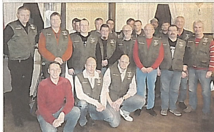
Tagung der Fischereiaufseher.